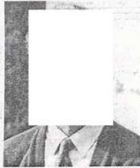
Il sindaco di Pavullo

abbiamo appreso del parere espresso dal servizio difesa del suolo della Regione sulla possibilità di costruire sopra il complesso boschivo di Gaiato Pianelli. Dal documento emerge inequivocabilmente che deve considerarsi definitivamente