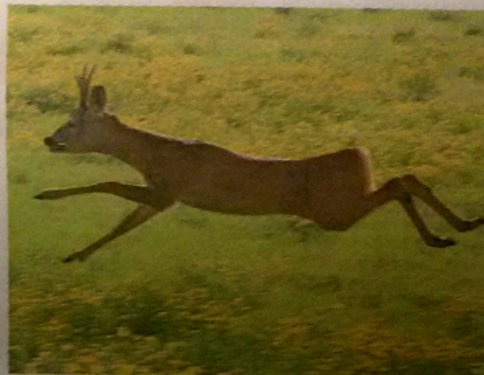
I caprioli possono essere un pericolo per automobilisti e centauro

Il giudice dunque dà torto alla vittima, che, su disposizioni del Tribunale, dovrà anche pagare le spese processuali con 7mila e duecento euro per ciascuno degli enti chiamati in causa. (gib)